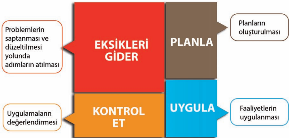
Şekil 8. Yıllık Faaliyetler İçin Plan Döngüsü

Okul afet ve acil durum yönetimi planları bir kere hazırlanarak bırakılan belgeler olmamalıdır. Okulun kapasitesi ve durumundaki değişimlere, tatbikatlardan ve yıllık eylem planındaki faaliyetlerden elde edilen deneyim ve derslere göre yılda en az bir kere revize edilmelidir. Okul afet ve acil durum yönetimi planıyla uyumlu olacak şekilde yıllık faaliyet planının hazırlanması ve uygulanması son derece önemlidir. Yıllık faaliyetlerin planlama döngüsü Şekil 8’de gösterildiği gibi planla, uygula, kontrol et ve eksikleri gider şeklinde olmalıdır. Her faaliyetin mutlaka bir değerlendirmesi yapılarak problemler saptanmalı ve düzeltilmesi için gerekli çalışmalar yapılmalıdır.