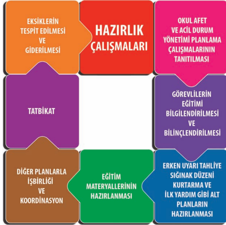
Şekil 4. Afete Hazırlık Çalışmaları Döngüsü

Afetin kısa süreli ve direk etkilerine hitap eden müdahale faaliyetleri ile afetin olumsuz etkilerini gidermek için bilgi ve becerilerin uygulanması, güvenliğin artırılması, olası tehditlerin nedenleri ve kaynağının araştırılması, gözetim ve denetimlerin artırılması, aksayan hizmetlerin en kısa sürede sürdürülebilirliğinin sağlanması faaliyetleri de eş zamanlı olarak yürütülmelidir. Bu nedenle bu evrede hızlı değerlendirme ve temel bilgilerin elde edilmesi ve artçı olay olasılıklarının değerlendirilmesi bu sürecin sağlıklı yürütülmesinde büyük önem taşımaktadır.