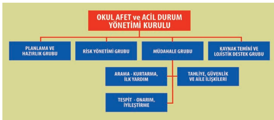
Şekil 2. Kurumsal Yapılanma Örneği

Okul Afet ve Acil Durum Yönetiminin kurumsal yapıları ve örgütlenme modelleri, karşı karşıya buldukları tehlike ve risklerinin çeşidi, büyüklükleri, sıklıkları, yol açabilecekleri zincirleme etkiler ve okulun büyüklüğü ile insan yoğunluğu gibi değişkenler dikkate alınarak belirlenmelidir. Bu yapılanmada önceden belirlenmiş katı ve değişmez şablonlar yerine esnek ve ihtiyaca göre değişebilen yapılarda çalışma gruplarının oluşturulması önerilir. Bu konuda bir kurumsal yapılanma modeli örneği Şekil 2’de verilmiştir.