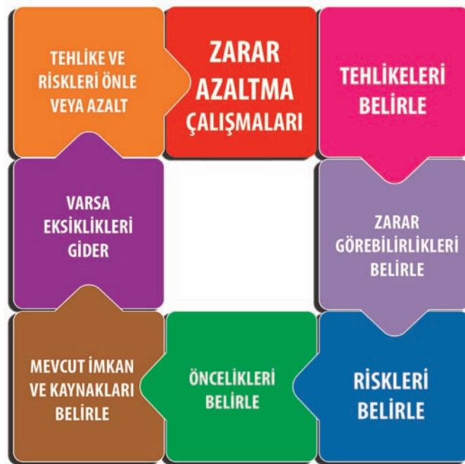
Şekil 3. Zarar Azaltma Çalışmaları Döngüsü

Zarar Azaltma çalışmalarına ait yapılması gerekenler Şekil 3'de şematik olarak özetlenmiştir.