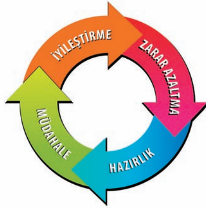
Şekil 1. Okul İçin Afet Yönetim Döngüsü

Okullarda Afet ve Acil Durum Yönetimi Sistemi oluşturabilmek ve afet planlaması ile afetlerle ilgili çalışmaları yürütebilmek için öncelikle afet veya acil durumu gerektiren sürecin hangi safha veya aşamalardan oluştuğunu dikkate almak gerekmektedir (Şekil 1).