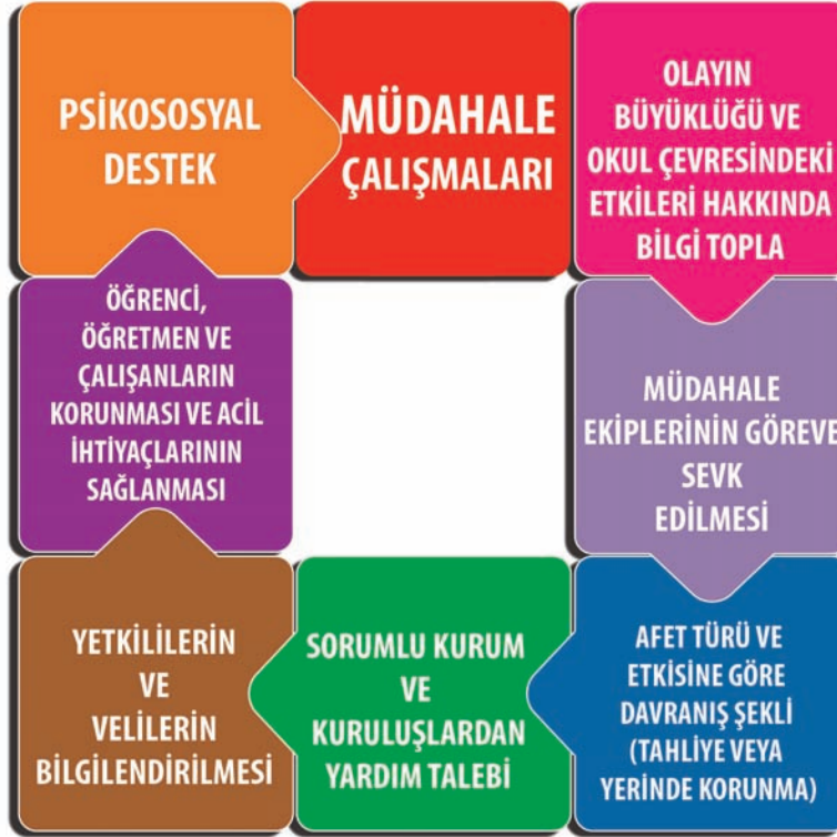
Şekil 5. Müdahale Çalışmaları Döngüsü